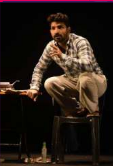
Actor Jatin Sarna in play Khidki at Parwaaz 2023