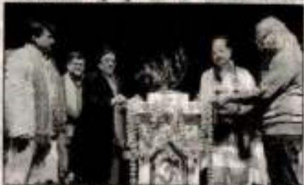
इसका समापन में अंतरराष्ट्रीय नाट्य महोत्सव का आयोजन करने वाला संघ विगत शुक्रवार को विभिन्न कार्यक्रमों का आयोजन कर रहा था।

पटना (एएसएनबी)। सांस्कृतिक संस्था इमैजिनेशन का 10वाँ अंतरराष्ट्रीय नाट्य महोत्सव परवाज-2023 शुक्रवार को समाप्त हो रहा है।