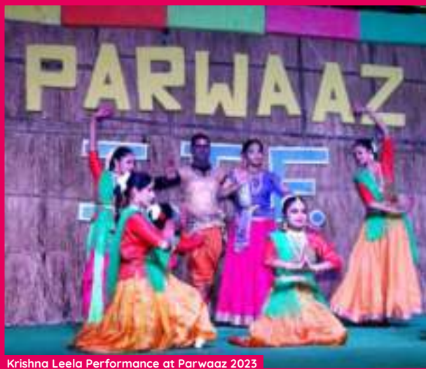
Krishna Leela Performance at Parwaaz 2023