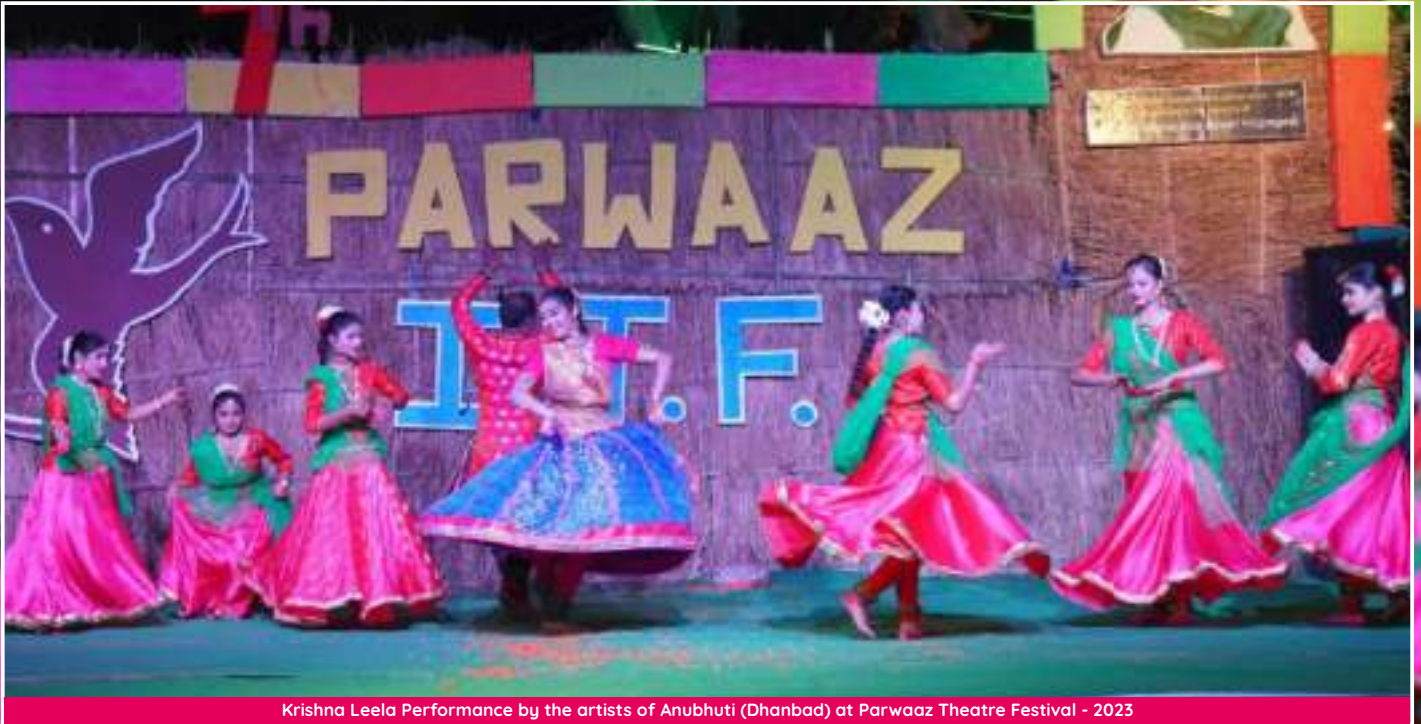
Krishna Leela Performance by the artists of Anubhuti (Dhanbad) at Parwaaz Theatre Festival - 2023