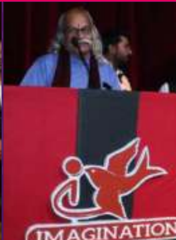
Padma Shri Prof. H.C. Verma Author & Physicist (IIT Kanpur)