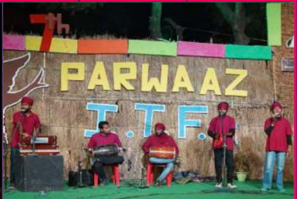
Kabirnama Musical Performance at Parwaaz 2023