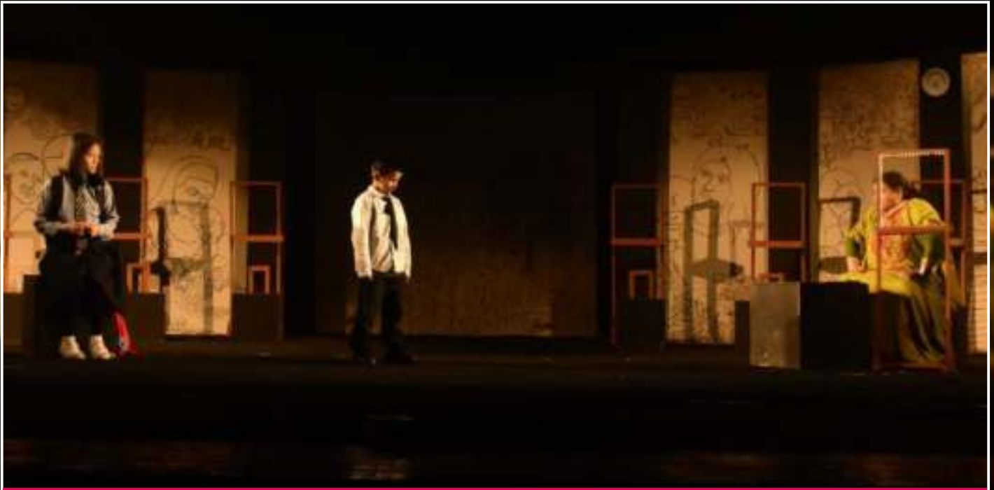
Performance of the Play 'Hasi' Directed by Viinod Rai and Written by Mamta Mehrotra by the artists of Imagination Bihar