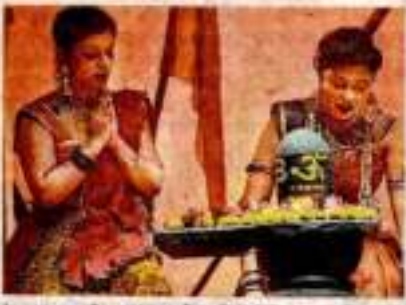
इसका समापन में अंतरराष्ट्रीय नाट्य महोत्सव का आयोजन करने वाला संघ विगत शुक्रवार को विभिन्न कार्यक्रमों का आयोजन कर रहा था।

नाट्य महोत्सव 'परवाज-2023' का समापन समारोह के दौरान बांग्लादेश के कलाकारों की शानदार प्रस्तुति का विशेष जिक्र किया। अंतरराष्ट्रीय नाट्य महोत्सव का समापन समारोह के दौरान बांग्लादेश के कलाकारों की शानदार प्रस्तुति का विशेष जिक्र किया।